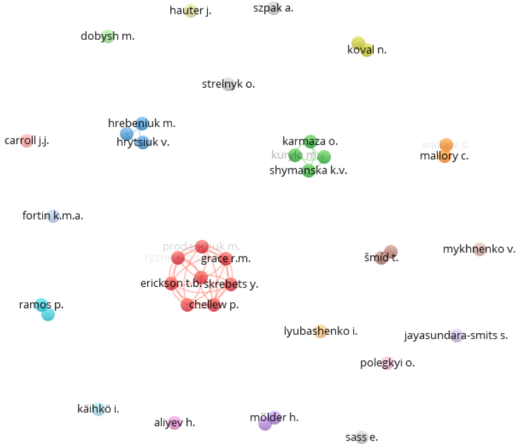
Рис. 1. Візуалізація мережі авторів статей про збройний конфлікт в Україні (Scopus, 2017–2021 рр.)

Таким чином, використання можливостей бібліометричного пошуку Scopus, узагальнення його результатів, та візуалізація результатів засобами інформаційних технологій (зокрема, VOSViewer), надають нові можливості для аналітичного огляду літератури з проблеми дослідження. Результати дослідження інтегровано в один з модулів курсу «Багатомірні методи в соціології», який викладається для магістрів соціології. Подальший напрямок роботи: вивчення можливостей цифрової етнографії в контексті дослідження конфліктів.